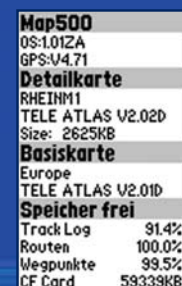
Bewährte Detailkarten von Teleatlas: Optional verfügbar. Große Speicherkapazität durch CF-Karten.