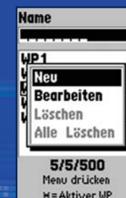
Menüsteuerung: In 6 Sprachen umschaltbar. Deutsch, englisch, französisch, spanisch, italienisch, niederländisch.